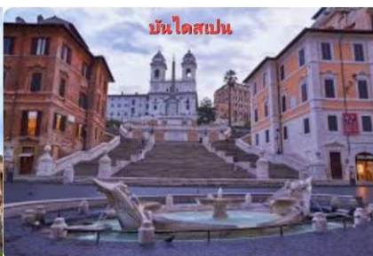
บันไดสเปน