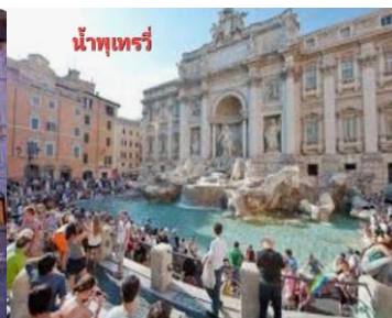
น้ำพุเทรวิ