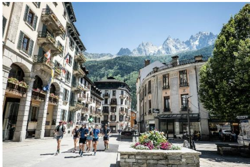
อีสระให้ท่านชมเมืองหรือช้อปปิ้ง

นำท่านชมเมืองซาโมนิกซ์ ที่ล้อมรอบด้วยขุนเขาสูง อีสระให้ท่านเพลิดเพลินเดินเล่น ชมเมือง ซาโมนิกซ์ ที่เป็นเมืองตากอากาศที่สวยงาม และมีการตกแต่งบ้านเรือนไว้อย่างสวยงาม ให้ท่านเดินเล่นช้อปปิ้งสินค้าพื้นเมืองของฝากของที่ระลึกมากมายกับบรรยากาศอบอุ่นไปด้วยภูเขาสูง หากอากาศดี ๆ ท่านสามารถมองเห็น ยอดเขามองบลั่ง ที่สูงถึง 4,807 เมตร สูงสุดในยุโรป และ อันดับที่ 11 ของโลก