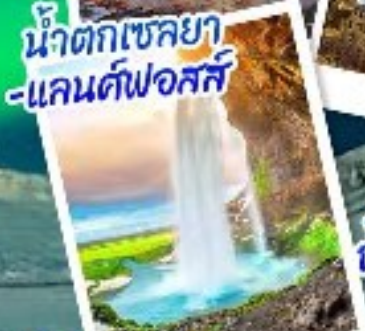
น้ำตกเซลยาแลนคฟอสส์