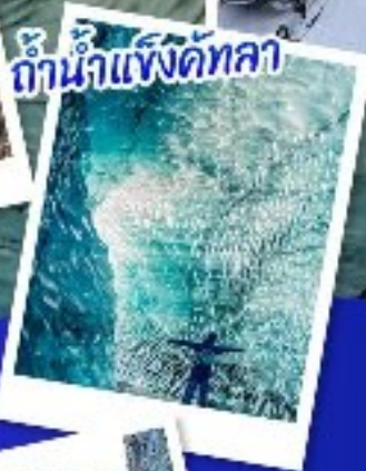
ถ้ำน้ำแข็งคัทลา