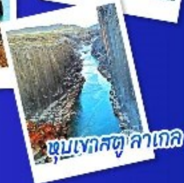
ชุมชนทะเลสาบสีน้ำเงิน