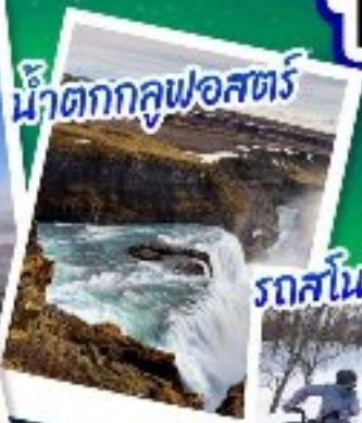
น้ำตกกุลฟอสต์