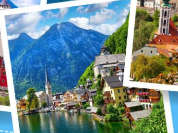
เมืองฮอลสตัดท์