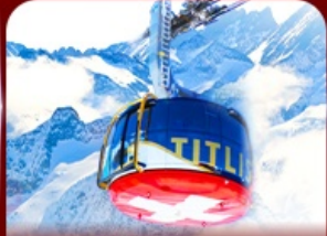
*Optional* นั่งกระเช้าชมวิวกิตติส