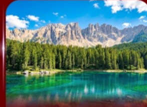
ชมวิวดโกลิมท์ ทะเลสาบคาเรชชา