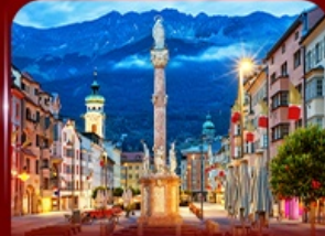
เที่ยวย่านเมืองเก่า อินส์บรุค