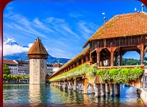
สะพานไม้อาเปลา ลูซิริน