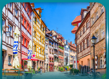
เที่ยวเมืองเก่าบูเรมเบิร์ก