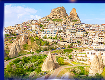
หุบเขาอูชิซาร์ คัปปาโดเกีย