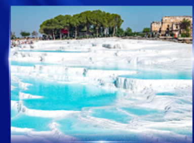
ปราสาทบุษบิาข บามุกคาคา