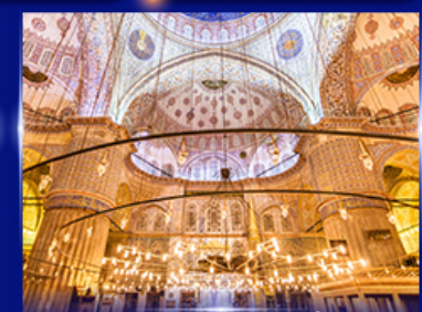
เข้าชมความงามสุเหร่าสีน้ำเงิน