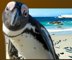
Simon's Town ฆนฝูงเพนกวิน