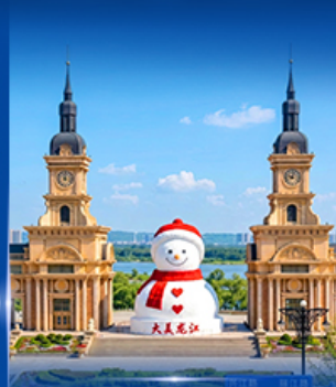
ตุ๊กตาหิมะยักษ์ ฮาร์บิน