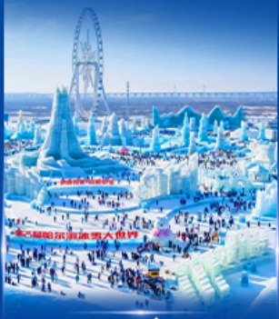
เทศกาลหิมะและน้ำแข็ง 2027