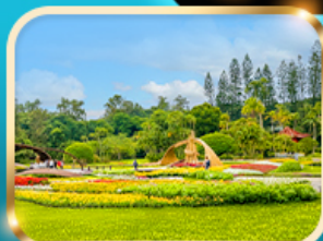
สวนบ้านปรน.เจียงไคเชิก