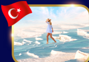
ปราสาทปุยฝ้าย ปามุคคาเล่