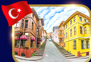
ชมบ้านหลากสี ย่านบาลีก