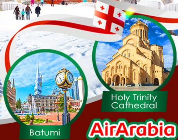
Holy Trinity Cathedral