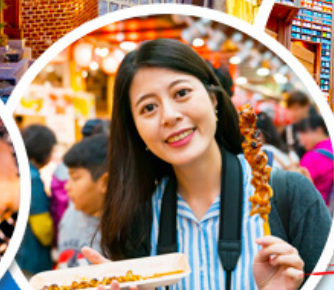
ตลาดควางจ้ง