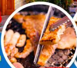
นมูย่างเกาหลี