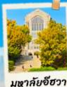
มหาชัยชีวา