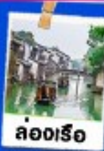
ล่องเรือ