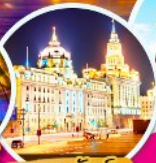
เดอะบันด์