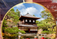
ชมสวนสไตลญี่ปุ่น.. Ginkakuji Temple