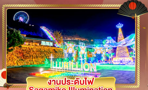
งานประดับไฟ Sagamiko Illumination