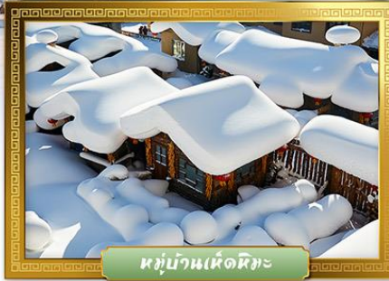
หมู่บ้านเห็ดหิมะ