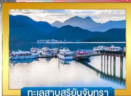
ทะเลสาบสุริยอันจันทร์