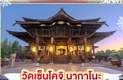
วัดเซ็นโคจิ นากาโนะ