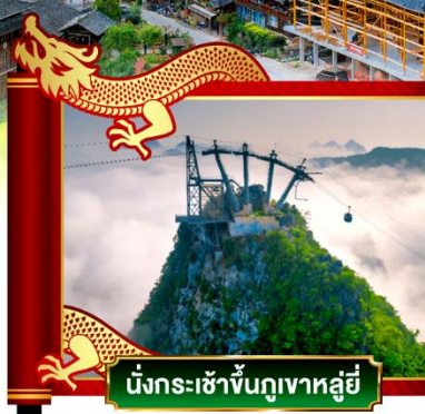
นั่งกระเช้าขึ้นภูเขาหลูอี้