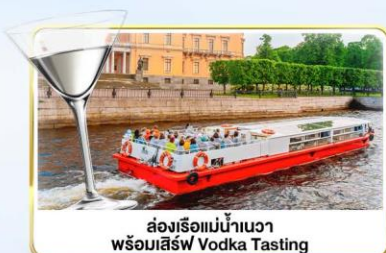
ส่องเรือแม่น้ำเนวา พร้อมลิ้ม Vodka Tasting