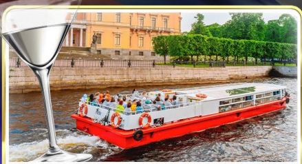
ล่องเรือแม่น้ำวอวา พร้อมเสิร์ฟ Vodka Tasting