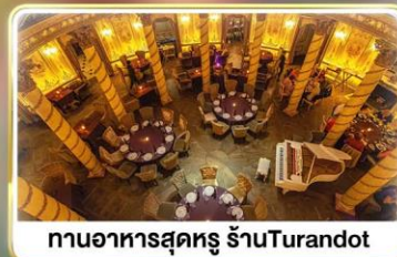
ทานอาหารสุดหรู ร้านTurandot