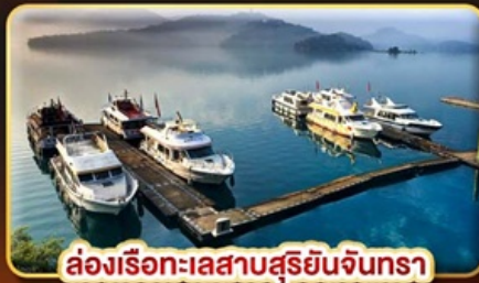
ล่องเรือทะเลสาบสุริยจันทราร