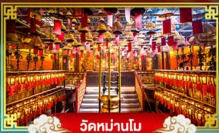
วัดหม่าโม

พักผ่อน "ริมฟ้ารุ่ง" บินรดลองเทศกาลปีใหม่ ณ เกาะฮ่องกง