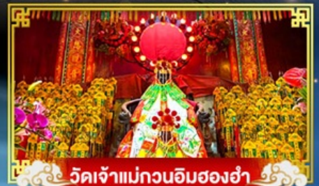
วัดเจ้าแม่กวนอิมสองฮ่า