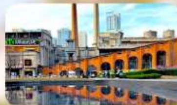
ตงเจียวจื่ออี้