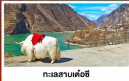
ทะเลสาบเต๋อซี