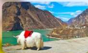
กะเลสาบเต๋อซี