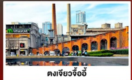
ตงเจียวจ้ออ๊