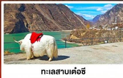
ทะเลสาบเต๋อซี