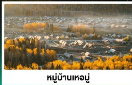
หมู่บ้านหอย