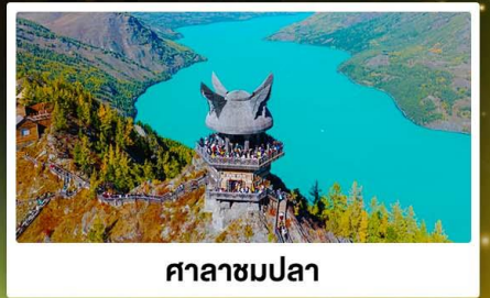
ศาลาชมปลา