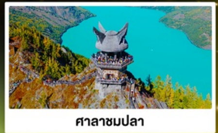
ศาลาชมปลา