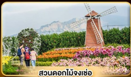
สวนดอกไม้จ้งเซ่อ

เค้กัฒดาวนัฒฏัฏทไทเป 101 แซ่หน้าแร่ส่วนตัวในห้องพัก