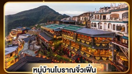
หมู่บ้านโบราณจ้วฝัฒ