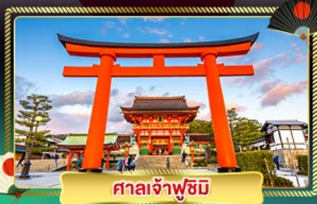
ศาลเจ้าฟูชิมิ