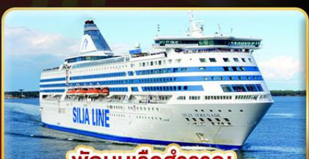
พักบนเรือสำราญ แบบ Window Room 2 คืน