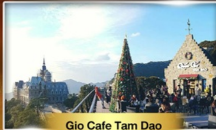
Gio Cafe Tam Dao