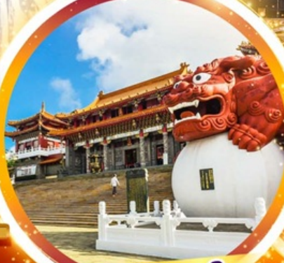
วัดหวินหฺวู่