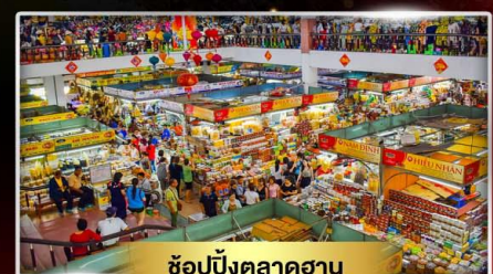
ช้อปปิ้งตลาดฮาน