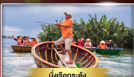
นั่งเรือกระดง