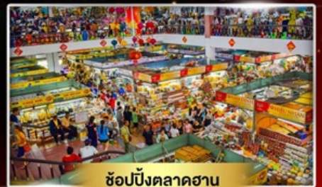
ช้อปปิ้งตลาดฮาน