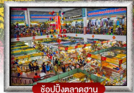
ซ้อปิ้งตลาดฮาน