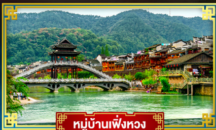
หมู่บ้านเฟิ่งหวง

ชุมชนระดับโลกกลางผาหนามจก "ฟ่านจิ่งซาน" ท่องสูดดินแดนแห่งภาพวาดจางเจียเจีย