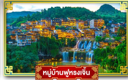
หมู่บ้านฟุรงเจิน