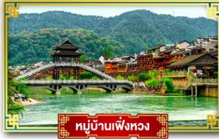
หมู่บ้านเฟิ่งหวง