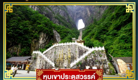
ทิวเขาประตูสวรรค์