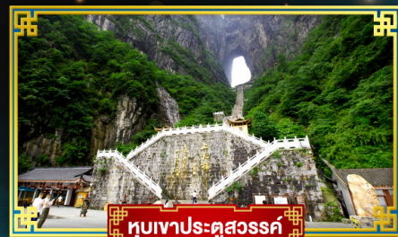
ภูเขาประจูดสวรรค์