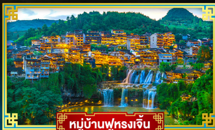
หมู่บ้านฟุ่หลงเจิน