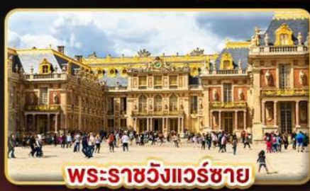
พระราชวังแวร์ซาย