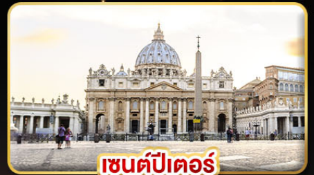
เซนต์ปีเตอร์