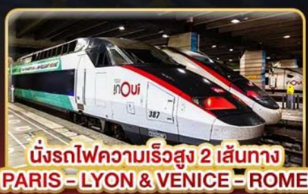
นั่งรถไฟความเร็วสูง 2 เส้นทาง PARIS - LYON & VENICE - ROME

📅 เดินทาง : 11-20 ก.พ. 68 / 15-24 มี.ค. 68 05-14 เม.ย. 68 / 29-08 พ.ค. 68