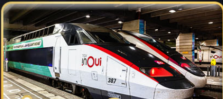
นั่งรถไฟความเร็วสูง 2 เส้นทาง PARIS - LYON & VENICE - ROME

✈️ เติมนทาง : 11-20 ก.พ. 68 / 15-24 มี.ค. 68 05-14 เม.ย. 68 / 29-08 พ.ค. 68