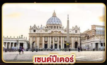
เซนต์ปีเตอร์