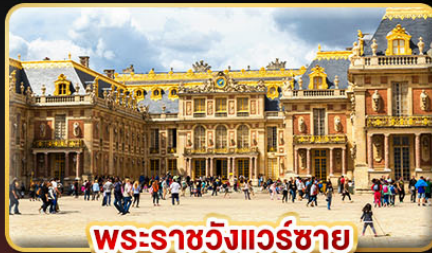
พระราชวังแวร์ซาย