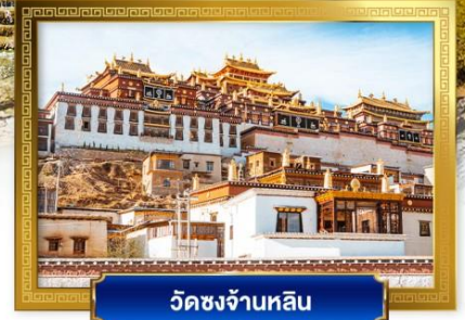
วัดชงจ้านหลิน