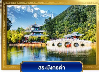
สระมังกรดำ