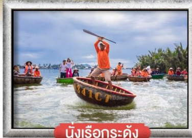
นั่งเรือกระดัง