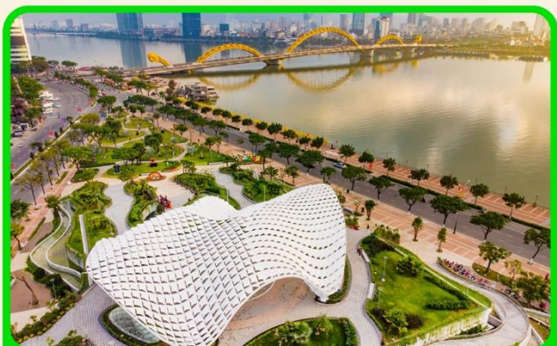
เช็คอิน แหล่งที่เที่ยวยุคใหม่ APEC PARK