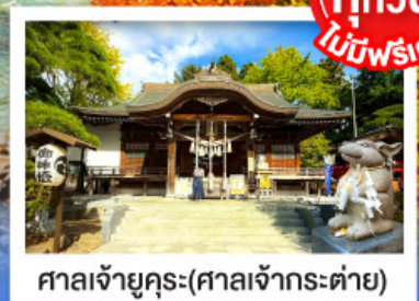
ศาลเจ้ายุคุระ (ศาลเจ้ากระต่าย)

พิเศษบุฟเฟ่ต์ซาบุดะพรีเมียม ปูออกโทโด อาหารทะเล เนื้อวากิว สเต็ก ซูชิอุคุระ และเครื่องดื่มไม่อัน