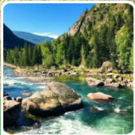
อุทยานเคอเคอทัวไห่