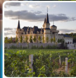
ไร่ไวน์ จุนยี่ เยียนโก