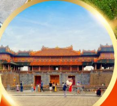
พระราชวังโบราณไดโนย