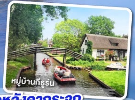
หมู่บ้านทีร์รูน

พิเศษ ล่องเรือหลังคากระจก ชมความสวยงามของกรุงอัมสเตอร์ดัม