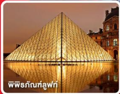
พิพิธภัณฑ์ลูฟว์