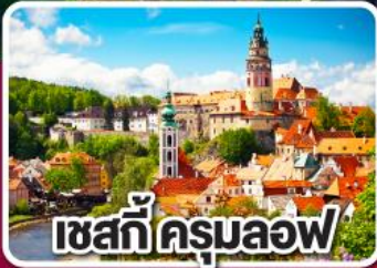
เชสกีครุมลอฟ

ฮังการี สโลวาเกีย ออสเตรีย เชก 7 วัน 4 คืน