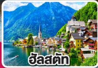
ฮัลสตัดท์