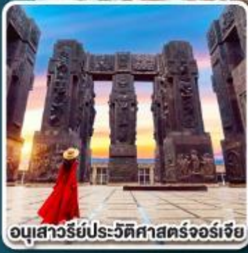
อนุสาวรีย์ประวัติศาสตร์จอร์เจีย

การ์นตี ห้องพักรีวิวเทือกเขาคอเคซัส ที่โรงแรม ROOMS