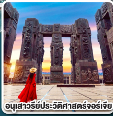
อนุสาวรีย์ประวัติศาสตร์จอร์เจีย

การ์นต์ ห้องพักรีวิวเทือกเขาคอเคซัส ที่โรงแรม ROOMS