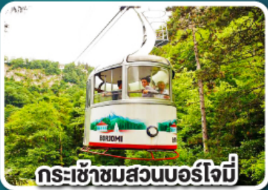
กระเช้าชมสวนบอร์โจมี