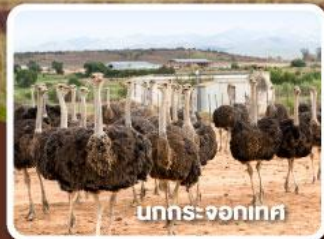
บกระทระจอกเทศ