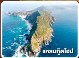
แหลมกู๊ดโฮป