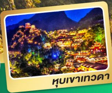
หุบเขาเทวดา