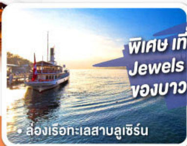
ล่องเรือทะเลสาบลูเซิร์น

พิเศษ เที่ยวครบเส้นทาง Jewels of Romantic Europe ของบาวาเรียและทิโรล