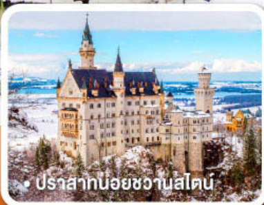
ปราสาทน้อยชวานสไตน์