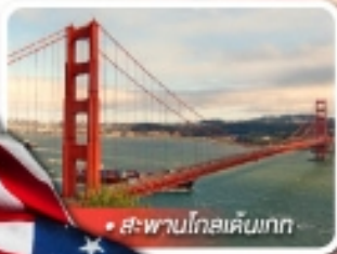
สะพานโกลเด้นเกต