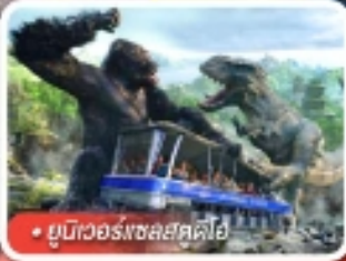
ยูนิเวอร์สอลสตูดิโอ