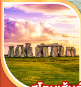
สโตนเฮ็นจ์