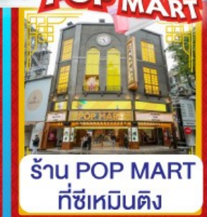
ร้าน POP MART ที่ซีเหมินติง