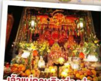
เจ้าแม่กวนอิมฮ่องกง