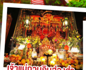
เจ้าแม่กวนอิมฮ่องฮำ