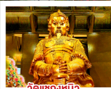
วัดแควงหมิว